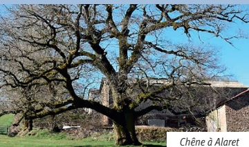
Chêne à Alaret