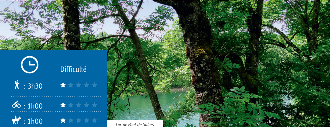
Lac de Pont-de-Salars