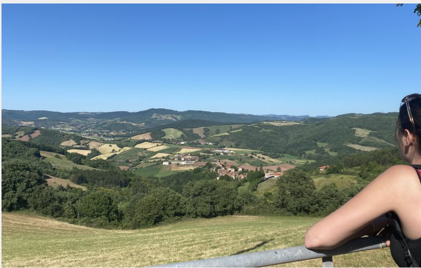
Sur les chemins de femmes de la terre (Roquefort Tourisme)

CC Saint Affricain, Roquefort, Sept Vallons - Calmels-et-le-Viala