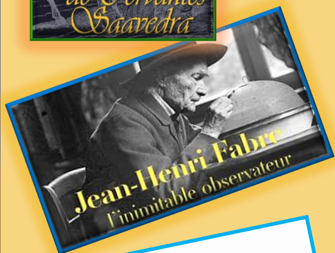
Jean-Henri Fabre l'inimitable observateur