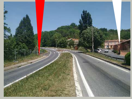
Terres cuites Raujolles

Vous arrivez depuis... RD992 Albi St Affrique