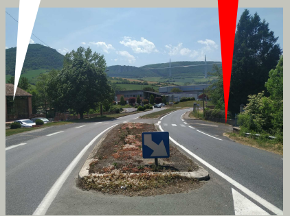
C'est ici !