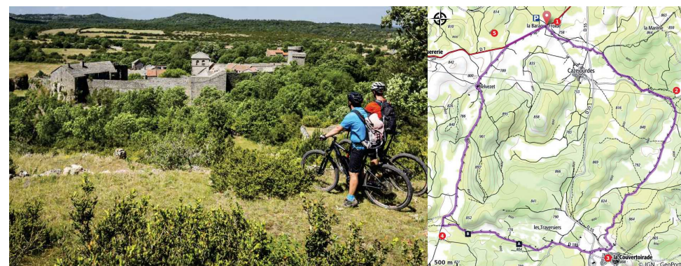
Le village templier de La Couvertoirade

Des Gorges du Tarn au Causse du Larzac - La Couvertoirade