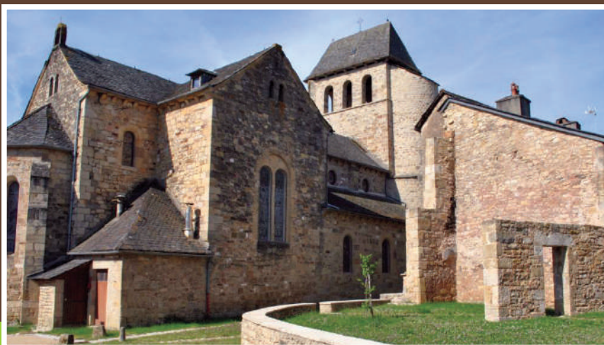
Cœur du village fortifié