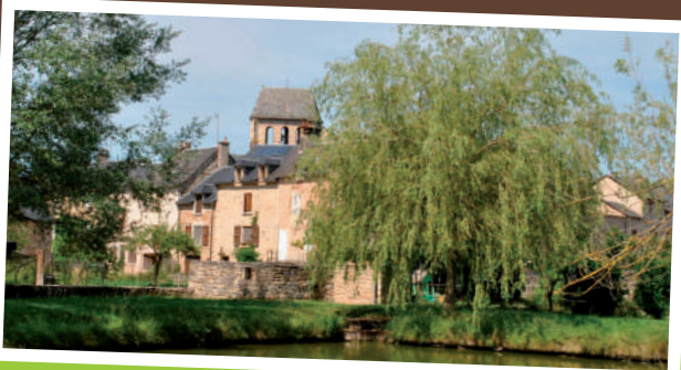
Vue du village