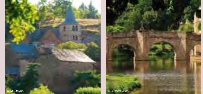
DRUELLE-BALSAC LE MONASTERE