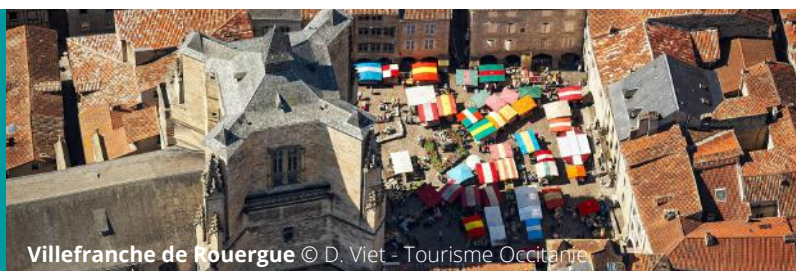
Villefranche de Rouergue