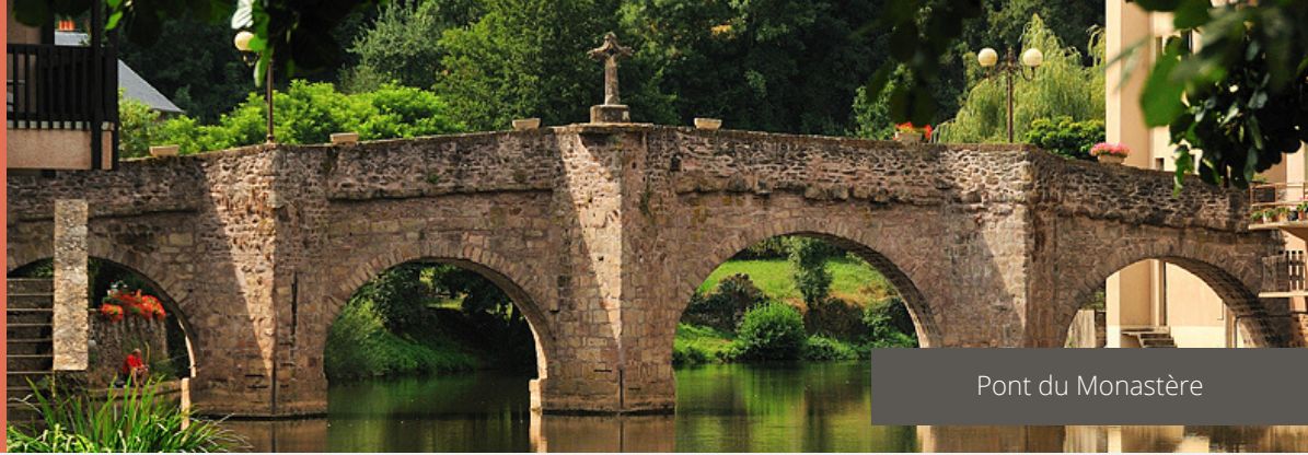
Pont du Monastère