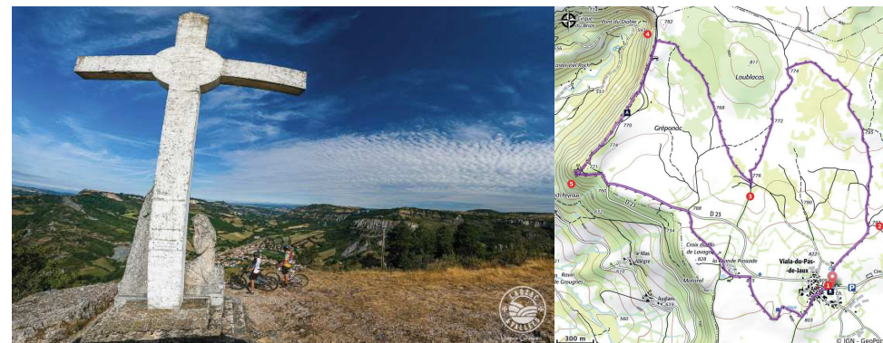
Le panorama depuis la croix de Gréponac

Des Gorges du Tarn au Causse du Larzac - Viala-du-Pas-de-Jaux