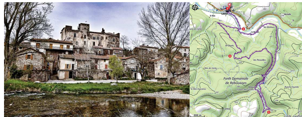
Le château de Latour

Des Gorges du Tarn au Causse du Larzac - Marnhagues-et-Latour