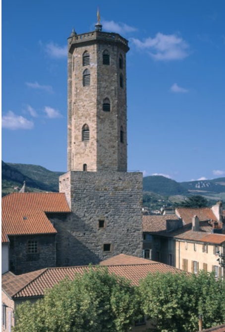
Tour des rois d'Aragon et beffroi, Ville de Millau

Visite libre : Les équipes de la tour des rois d'Aragon et du beffroi vous attendent. Mais attention, pour