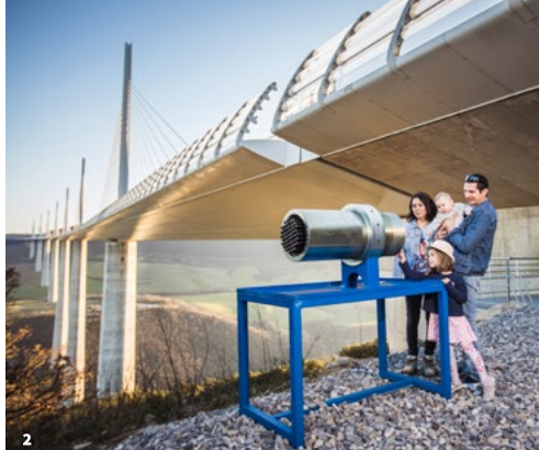
1. Site archéologique de la Graufesenque