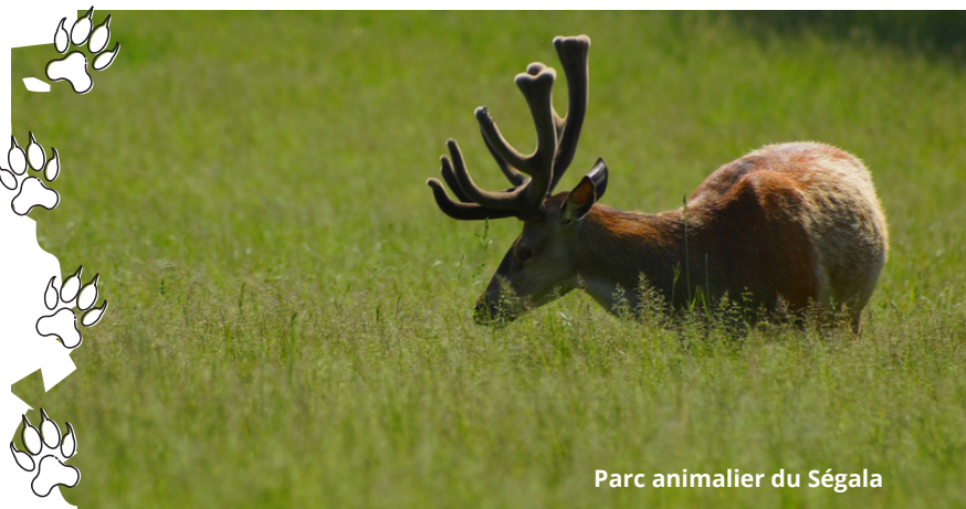
Parc animalier du Ségala

Notre conseil : Pour compléter la visite, rendez-vous à la Chapelle St Jean-Baptiste sur la montagne de Modulance, à 804 m. d'altitude. Elle domine la région du Ségala. Par temps (très) clair, vous pourrez apercevoir les monts et plateaux jusqu'aux cimes des Pyrénées (GPS : 44°18'57.3"N 2°13'43.1"E).