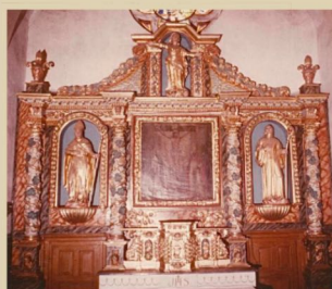
2 Crespin-église paroissiale Retable du maître-autel (XVII e -XVIII e siècles)