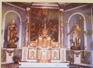
1 Crespin-église de Lespinassole Retable du maître-autel (XVIII e et XIX e siècles)