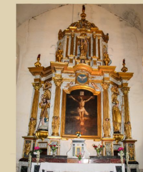
4 Sauveterre-de-Rouergue -église paroissiale Retable du maître-autel (XVII e siècle)