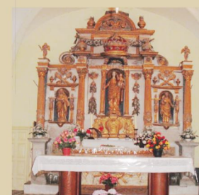
3 Saint-Just-sur-Viaur - chapelle N-D du Roucayrol Retable du maître-autel (XVII e siècle)