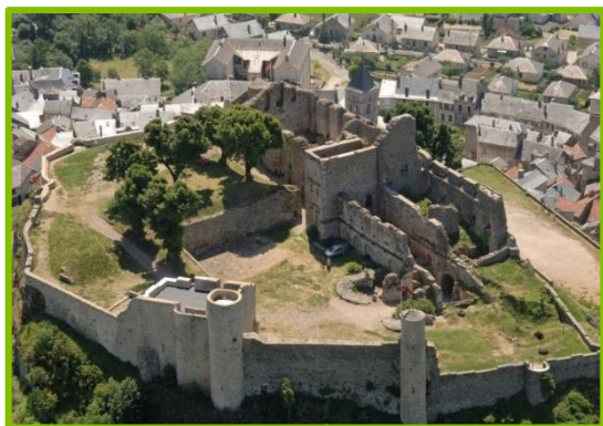
visite commentée : cité médiévale + château

Partez à l'assaut de cette cité médiévale au passé prestigieux découvrez se patrimoine exceptionnel en déambulant dans les ruelles, la Maison des consuls, le Sestayral (marché aux grains), l'église St Sauveur, la maison de Jeanne et la fontaine romaine.