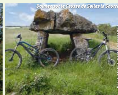
Dolmen sur le Causse de Salles la Source

VTT Salles-la-Source et le repos sportif