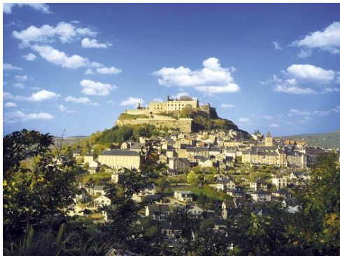
Cité médiévale de Sévérac le Château

Partez à la découverte d'une diversité de paysages naturels (Vallée du Lot, contreforts de l'Aubrac, Causse de Sévérac) et de villages pittoresques (St Laurent d'Olt, la Canourgue, la Roque Valzergues). Vous traverserez des sites remarquables où l'histoire tient une place importante ; le château et la cité médiévale de Sévérac d'Aveyron, Campagnac et ses mesures à grains ou encore les vestiges des thermes gallo-romains de St Saturnin de Lenne.