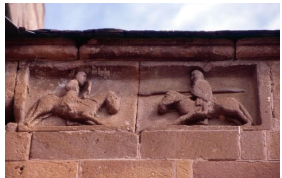
Combat de cavaliers-Eglise de St Saturnin de Lenne