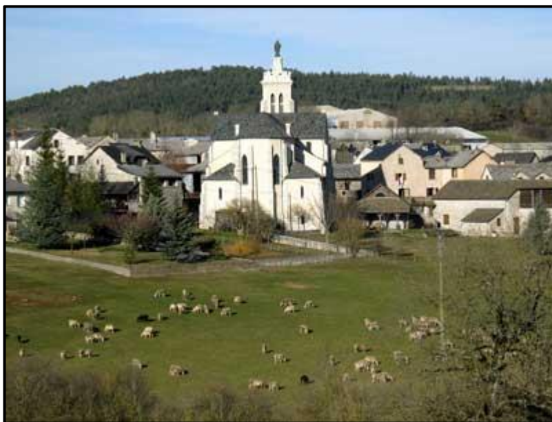
Village du Massegros

Un circuit familial, sans difficulté, pour s'avancer vers le causse de Sauveterre. Au Massegros, arrêtez-vous pour découvrir les maisons caussenardes et le four du village. En revenant vers Sévérac, vous pouvez faire un détour au hameau du Villaret pour y voir notamment son four et le lavoir.