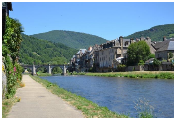
St Geniez d'Olt

Remontez le temps jusqu'au XVII ème siècle et découvrez St Geniez d'Olt et d'Aubrac avant de prendre de la hauteur en direction de Pomayrols et son château. En poursuivant votre route, une visite s'impose au village perché de St Laurent d'Olt. Tout au long du parcours un magnifique panorama s'offrira à vous sur L'Aubrac et les Gorges du Lot.