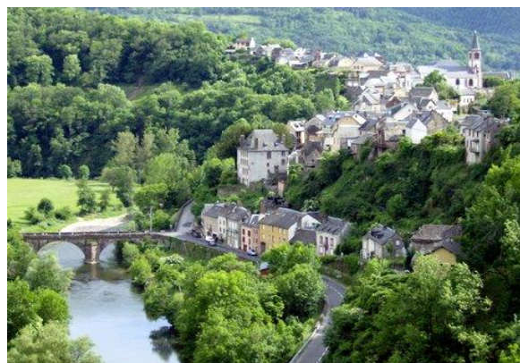
St Laurent d'Olt