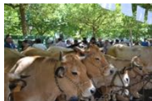
Fête de la Race Aubrac