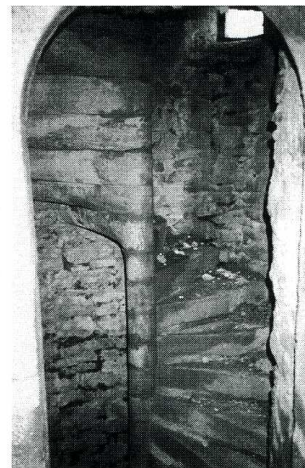
Le Clavier (Aveyron). Eglise Saint-Xist. 3. Voûte sur croisée d'ogives de l'abside. 4. Escalier à vis de la tourelle.