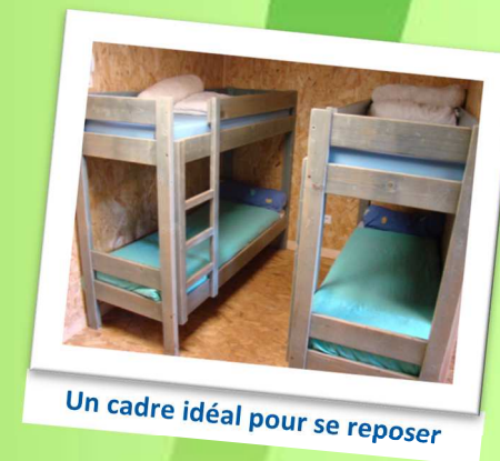
Un cadre idéal pour se reposer